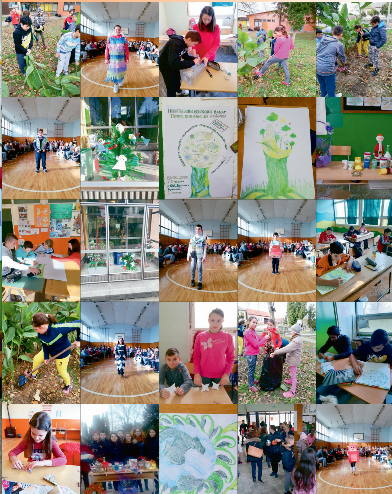
ФОТО МОЗАИК / MOZAIC FOTO

Редакција / Colegiul de redacție: Босилка Живановић, Елеонора Микља и Виолета Баба. Допринели су и / Au contribuit și: Дорина Дражила, Михаела Мохан, Милена Гуцу и Виолета Дадић.